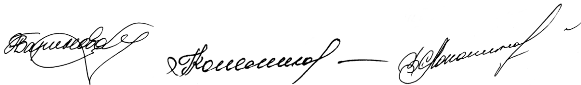
Рис. 1. Подписи буквенной транскрипции, обладающие высокой степенью информативности

Немалая роль при этом принадлежит именно монограмме — начальной усложненной части подписи, которая практически всегда содержит значительное количество информативно значимых признаков. Способы образования монограмм подписей самые различные [6, с.