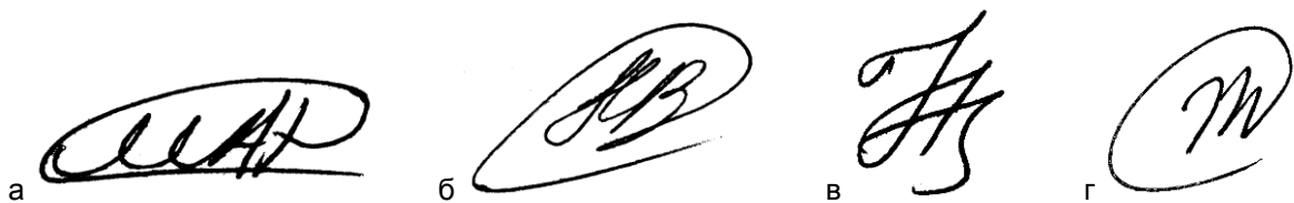
Рис. 2. Подписи, состоящие только из монограммы, выполненной от имени: а — Рубцова М. А.; б — Меженца С. В.; в — Никифорова К. З.; г — Животенко П. С.

65—75]. В то же время в экспериментальных материалах нами выявлены единичные подписи, состоящие всего лишь из одних монограмм, что существенно снижает степень их информативности (рис. 2).